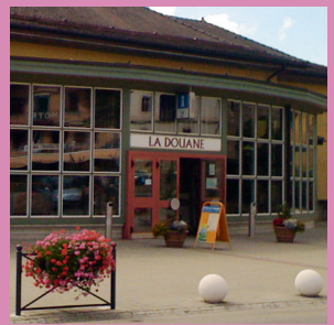
Salle de la Douane