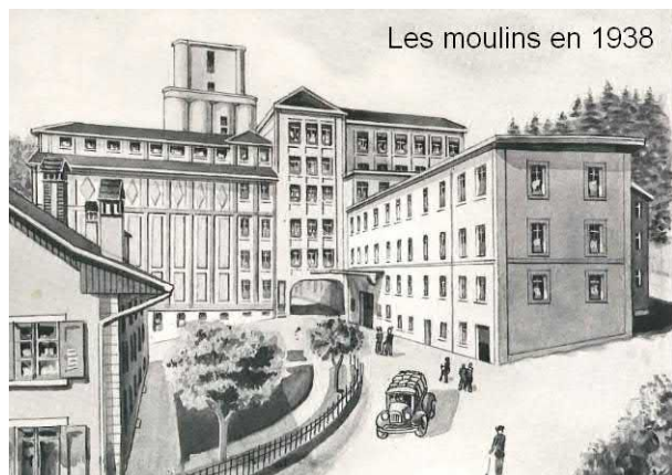
Les moulins en 1938

Pour revenir à nos moulins, la technologie a certes évolué et tout s'est automatisé, mais la configuration des installations de l'époque reste toujours la base des constructions ultra-modernes de nos jours.