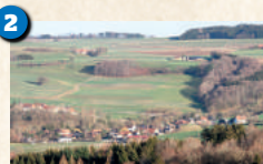
Vue sur Curtilles 46.703726 / 6.824980