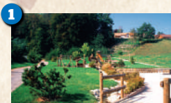
Place de jeux 46.705415 / 6.832524