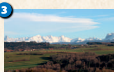
Vue sur le Molésou 46.699058 / 6.825958