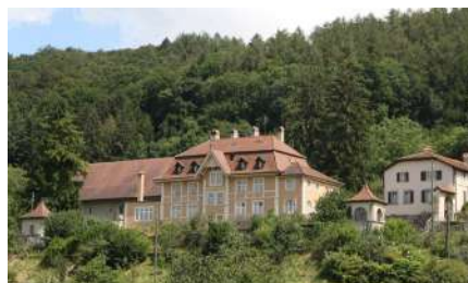
Le Château de Marnand